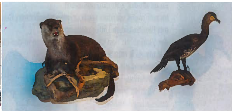
Diese beiden „Burschen“ haben auch einen Ehrenplatz im Büro des Oö. Landesfischereiverbandes erhalten – vor allem in einem uns Fischern sehr akzeptablen „Zustand“ :-)