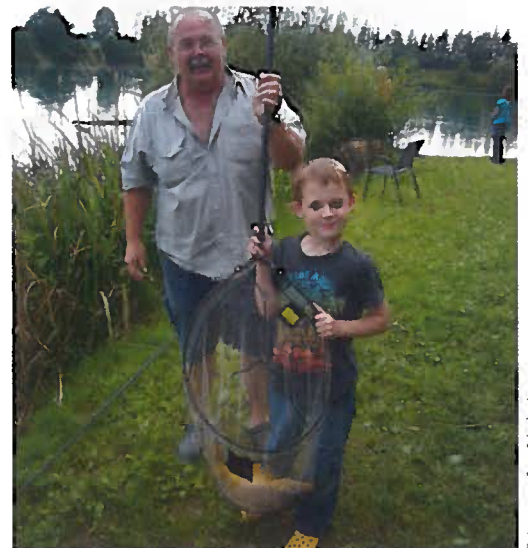
Besonders die Kinder- und Jugendförderung liegt dem Verband am Herzen!

Einen besonders hohen Stellenwert und Schwerpunkt nimmt die Förderung des fischenden Nachwuchses in Oberösterreich ein. Alle Schulen im Bundesland werden durch spezielle Fischerei-Schulkalender versorgt und diese sollen das Interesse der Kinder an unserem schönen Hobby wecken. Mein jüngster Sohn, der heuer die vierte Klasse der Volksschule besucht, war sehr stolz und glücklich, wie er einen davon als „Beute“ nach Hause brachte. Gefördert werden auch Vereine, die sich um Kinder und Jugendliche besonders bemühen und entsprechende Akzente setzen.