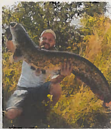
Auch solche Fänge sind in der Stadt möglich.