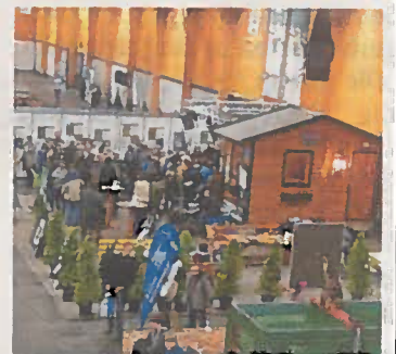
Am Stand wird ein umfangreiches Programm geboten.