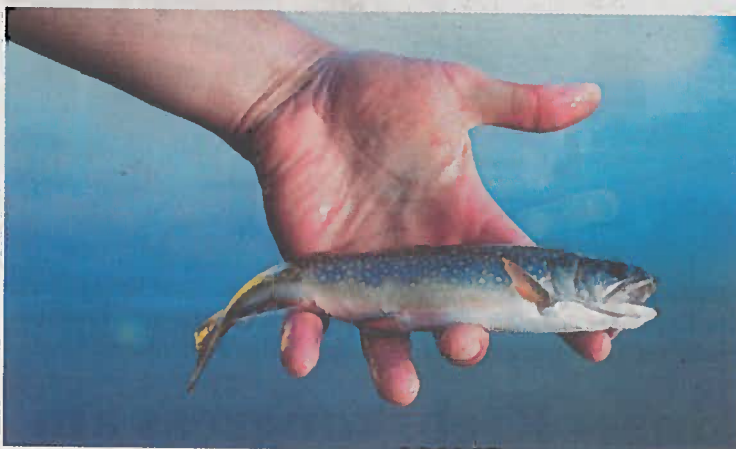
Bach- und Regenbogenforellen, Nasen, Äschen und Aalrutten in verschiedenen Größen wurden eingesetzt.

der OÖ. Landesfischereiverband. Im Vordergrund standen gezielte Fördermaßnahmen für gefährdete heimische Fischarten. So wurden 25.000 Nasen- und 3.000 Äschensetzlinge, jeweils etwa vier Zentimeter lange Fischbabys, sowie