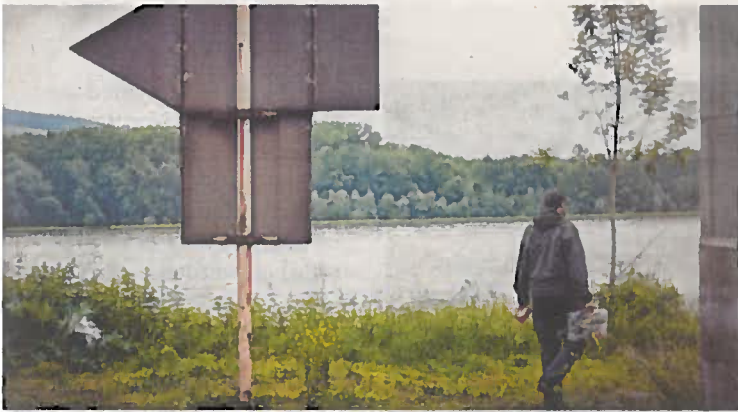
Hotspots in Linz sind das Voest- und das Hafengelände, das Steinmetzplatzl und das Zaubertal.