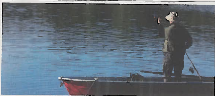
Wie man richtig angelt und was es dabei zu beachten gibt, lernt man im Fischerkurs.

Wer etwa ein Lizenzbuch kauft oder den Unterweisungsbeitrag zur Fischerprüfung in Oberösterreich zahlt, hilft damit, den Fischbesatz weiterhin zu ermöglichen. Je nach Streckenlänge bekommen die Bewirtschafter Anteile aus den Erlösen. Außerdem gibt es Förderungen des Landes OÖ für den Besatz von Nasen, Äschen und Bachforellen, dazu kommen Entschädigungsleistungen der Energie AG. Viele Bewirtschafter im Revier Traun-Linz sind jedoch sehr aktiv und führen auch über den verpflichtenden „Besatz-Schilling“ hinaus noch eigene Besatzmaßnahmen durch.