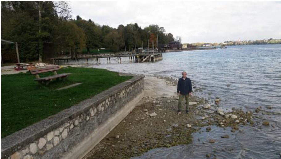
Beim Freibad Litzlberg steht das Wasser gewöhnlich bis zur Mauer.

LINZ / SEEWALCHEN. Pegel des Attersees um 46 Zentimeter zu niedrig. Tiefdruckgebiet bringt Regen