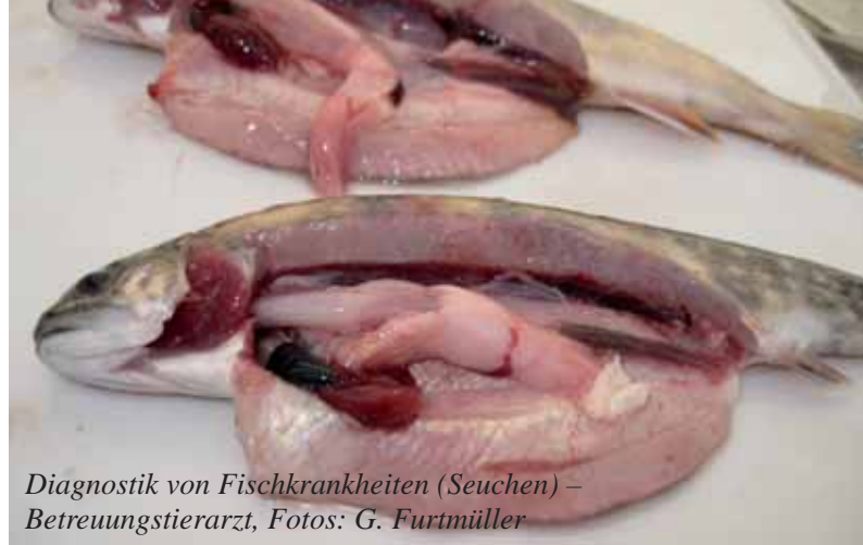
Diagnostik von Fischkrankheiten (Seuchen) – Betreuungstierarzt