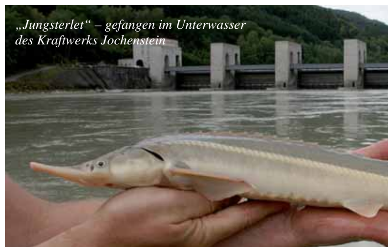
„Jungsterlet“ – gefangen im Unterwasser des Kraftwerks Jochenstein

Für alle an der Donau-Fischfauna interessierten besteht nur ein paar Dutzend Meter Luftlinie vom natürlichen Sterlet-Lebensraum eine besondere Attraktion. Im Nahebereich des Stifts Engelszell wurde ein Großaquarium errich-