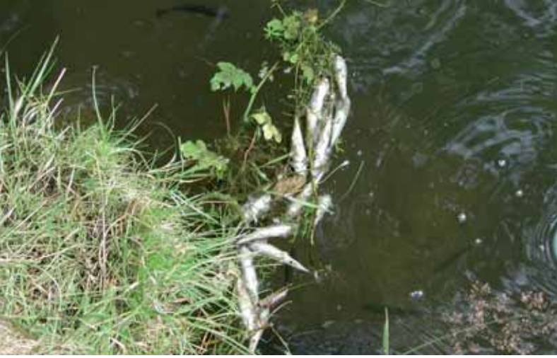
Seuchenbekämpfung – Teichdesinfektion Anzeige und Feststellung von Fischkrankheiten (Seuchen)

Endverbraucher bzw. an den Einzelhandel zur direkten Abgabe an den Endverbraucher) Es sind die gleichen Informationen und Unterlagen wie bei der Genehmigung von Aquakulturbetrieben erforderlich. Der Betreiber muss diese vor Aufnahme der Tätigkeit bei der Bezirksverwaltungsbehörde einbringen. Registrierte Betriebe bekommen eine Registrierungsnummer und werden ebenfalls in einer elektronischen Datenbank erfasst.