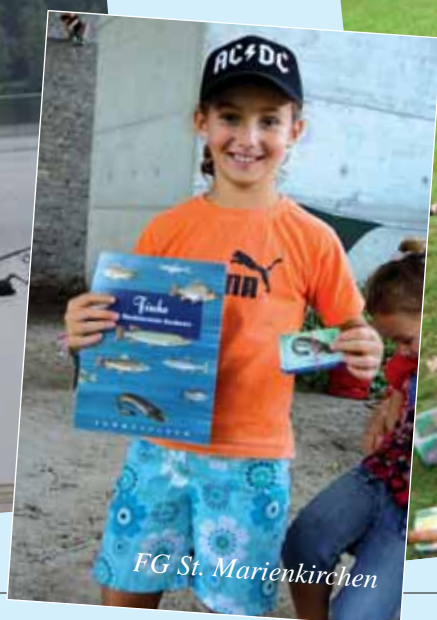
FG St. Marienkirchen