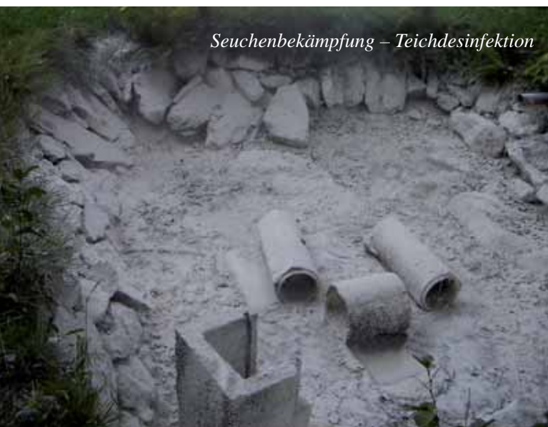
Seuchenbekämpfung – Teichdesinfektion