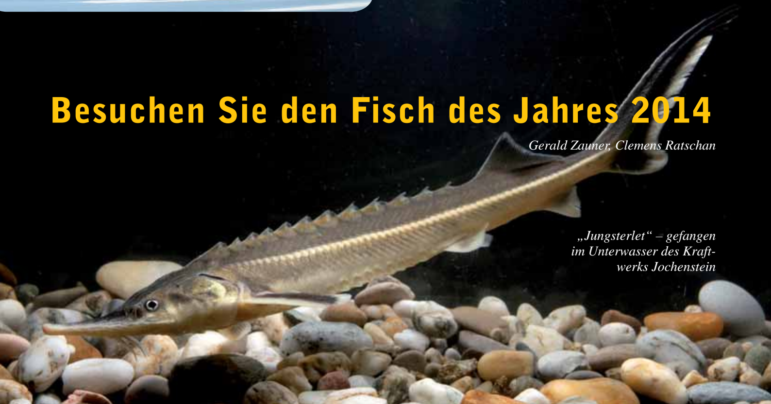
„Jungsterlet“ – gefangen im Unterwasser des Kraftwerks Jochenstein